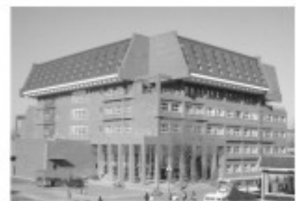
北京大学生命科学学院大楼

的人格。学习和科研不是一件苦差事,不需要强调学生一定要吃苦,但学生一定要喜欢自己从事的事业。从大学到研究生,学生会经历18岁到25岁,这是人生中极为关键又极难的阶段。18岁时尚未定型,什么职业都可以做,但到了25岁就突然变成了某一个领域的人。在这个阶段,学生应该花时间去积极寻找自己的兴趣,确定自己一生要做什么,目的是要找到自己的出路,而不是找到讨厌的东西。“学生要找到自己心灵上能够真的感到幸福的事情。”饶老师表达了自己对学生的期待。