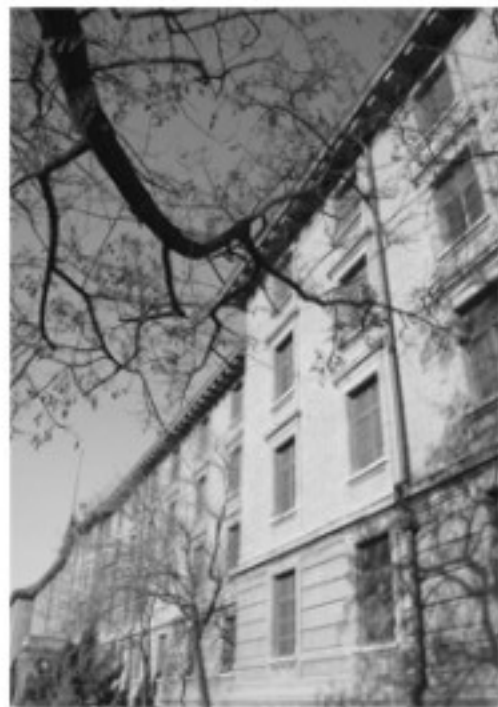
冬日晴空下的老北大沙滩红楼

考完一次试，无论是通过张贴名单还是发放成绩单的方式，大家都会知道自己考试的名次。每个高三学子多多少少都会在乎名次，不过这种对名次的“在乎”并没有什么益处。我的经验是，“知”名次而不“看”名次，也就