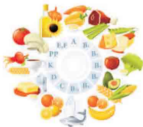
增强记忆力的食物

补脑的食物对增强记忆力还是有一定的帮助的，至少它们能够帮助你保持头脑的清醒和高度运转。