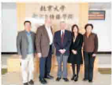
美国西北大学客人来访

近几年，新闻与传播领域的世界知名学者频频造访北大新闻学院，与北大学子研讨交流，带来最新的国外学科前沿动态，使学生们不出国门也能领略国外学者的风采。美国西北大学客人来访