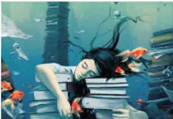
让自己的心静下来

我在高三刚开始时也会问自己，关于心态，方法的问题。但最后发现，每个人都有自己的节奏。有的人每天玩手机看小说到1点照样能考第一，但我必须11点睡，这样对我来说学习效率最高。这些问题，正是我们紧张心理的反应。高考能考出来的人，都会找自己的节奏，而不是跟着前人旁人的脚步亦步亦趋。学会用自己的脚步走自己的路，一切都会水到渠成。