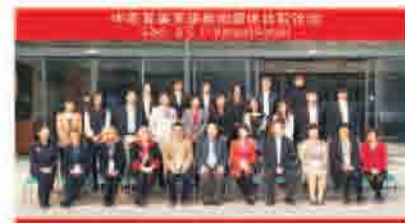
中美首届英语新闻媒体比较论坛

2012年，新闻与传播学院与美国伊利诺伊大学(香槟校区)传媒学院正式签署了广告教育项目合作协议。2013年，学院又与美国西北大学整合营销传播中心(IMC)达成合作意向，就“交流学生”、“双学位教育”、“博士生进修”等多个交流项目进行了协商，相关交流活动自2013年9月已逐步展开。2013年10月底，中美首届英语新闻媒体比较论坛由北大新传承办召开，本次论坛的主办方为北京大学与夏威夷大学，以此论坛为契机，两校今后将在新闻与传播学领域建立更为深入的长期合作。