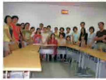
珍妮特·贝内特博士与同学们的合影

珍妮特·贝内特博士是世界知名的跨文化理论家和应用实践培训师，她的课程信息量大，互动性强，学生们积极参与。