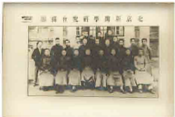
北京大学新闻学研究会

同年秋，蔡元培校长发起北京大学新闻研究会（后更名为“北京大学新闻学研究会”），是为中国历史上第一个新闻学研究团体和新闻教育机构。蔡元培出任会长，徐宝璜和邵飘萍担任导师，研究会汇集了毛泽东、罗章龙等会员。蔡元培亲临成立会进行演说，认为“凡事皆有术而后有学”，倡导中国新闻由职业向学科的转化。