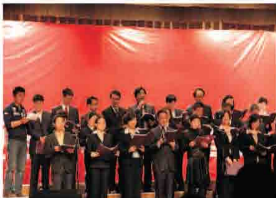
高三启动仪式：老师给同学们加油

对“高三”的体验远比成绩重要。过来人都说，高三的意义太丰富了。高三，不仅仅是一种折磨，不仅仅