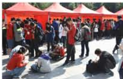
数学文化节趣味活动