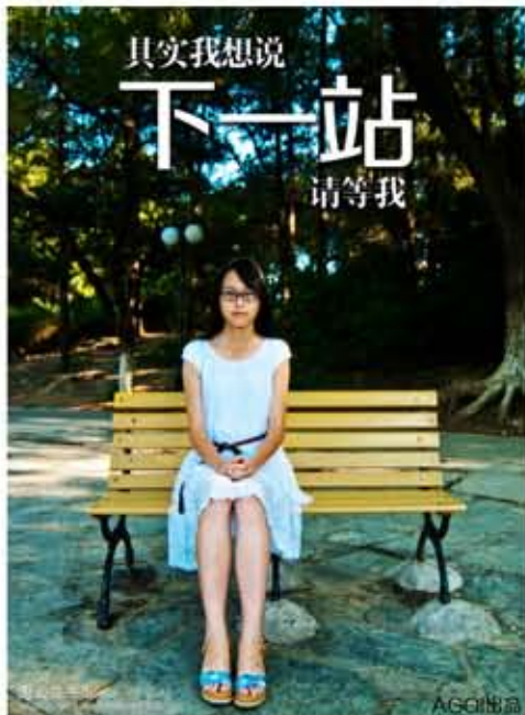
微电影《下一站》海报