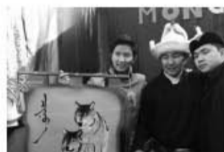
蒙古展台留学生展示狼图腾画作

缅甸展台人头攒动，走进一看，便会被展台的精美照片所吸引。辉煌灿烂的大金塔、充满了古韵的蒲甘、宁静优美的茵莱湖、气势恢弘的曼德勒……都让人仿佛身临其境。