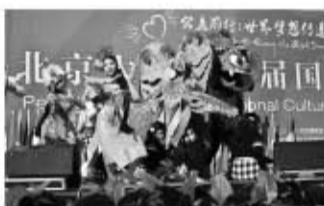
印尼留学生表演巴厘舞

充满宗教气息的泰国舞蹈，让台下的观众真切地领略到异域国度的风采，艳丽华贵的服装、轻盈优雅的动作、细腻传神的表情以及节奏明快的