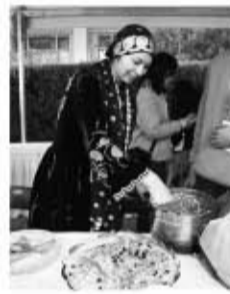
阿富汗留学生分享传统炒饭

夕阳西下，展台前的人们依然流连不愿离去，观众们通过观看表演、参与展台活动了解了各国公益活动的发展现状，对“公益前行：世界梦想传递”的文化节主题有了更为深刻的理解。凭借本届国际文化节的平台，北大倡导的公益服务精神得到了完美的展现、发扬和推广。通过各国文化的展示与