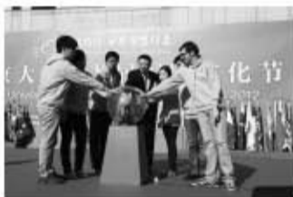
公益社团代表点亮“公益爱心”水晶球启动文化节

今年的国际文化节将“公益”的理念融入了留学生演讲、歌手大赛、网球比赛、摄影大赛等丰富多彩的常设活动，并特设“公益大讲堂”系列活动，邀请公益名人走进校园。同时，国际文化节还与校外机构合作举办了“丹麦文化日”、澳网公益行、非洲文化周等多种多样的文化节活动。