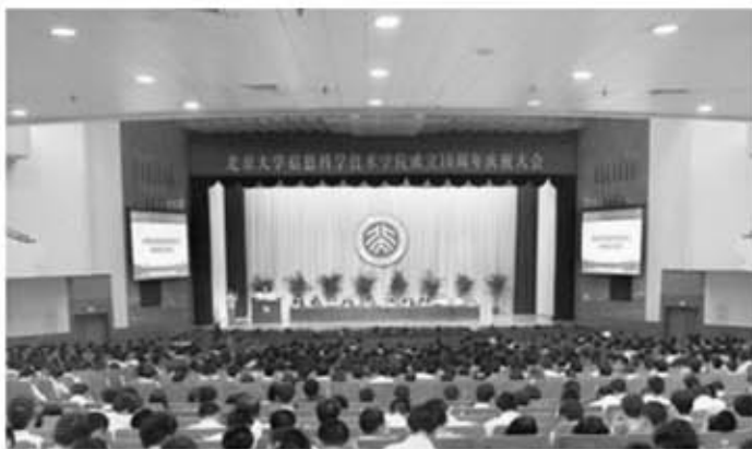
信息科学技术学院成立十周年大会

到了做毕业论文时及以后读研，几乎个个组里都有了PC。都玩疯了，开了壳的机箱，乌黑的键盘，大堆的软盘，不修边幅的学生，这是最典型的工作写照。