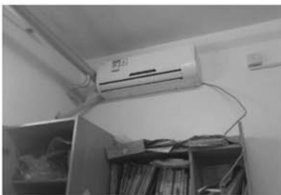
33楼第一个安装好的空调

事实上，对于安装空调，北大学生已经呼吁多年，也曾展开过多次讨论。有人认为是北方昼夜温差大，较之南方，夏天没有那么热，而且学校放假早，避开了高温段；有人则认为暑假很多同学仍然留校上小学期、实习等，如果没有空调就很难休息好，无法保证白天的工作学习。后勤作为学校的重要组成部分，影响着全校能否安全稳定运行的全局，校方在多次研究论证之后，决定改造线路、安装空调，并